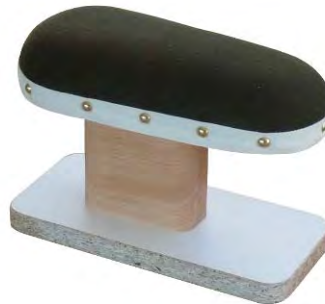
Artikel 54-88 Achsel-Bügelbock, mit Kork gefüllt auf Hartholzbock mit Pressspangrundplatte montiert. Größe: 25 x 11 cm.