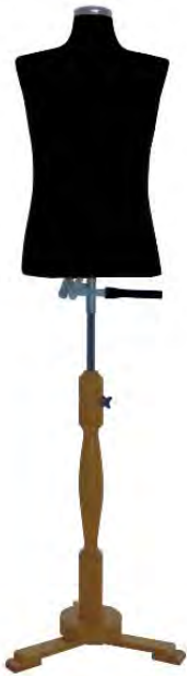
Abbildung zeigt Art. 54-80A + 54-102