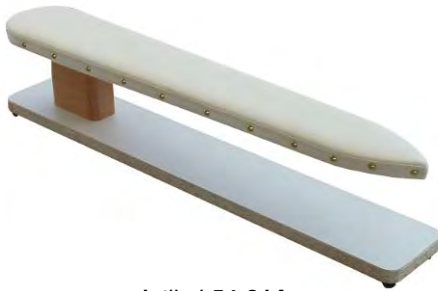
Artikel 54-21A Ärmel-Bügelbock, gleiche Ausführung wie Art. 54-21, jedoch in besonders breiter Ausführung. Größe: 80cm lang, 25cm breit.