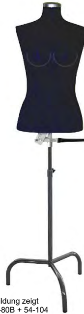
Abbildung zeigt Art. 54-80B + 54-104

Grund- größe: Verstellbar auf Größen: 46 = 47, 48, 49 und 50 48 = 49, 50, 51 und 52 50 = 51, 52, 53 und 54 52 = 53, 54, 55 und 56