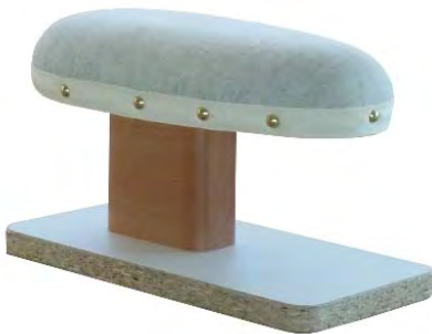
Artikel 54-14B Achsel-Bügelbock „Potsdamer Form“, mit Kork gefüllt auf Hartholzbock mit Pressspangrundplatte montiert. Größe: 33 x 20cm.