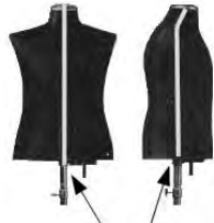
Dehnungsschlitze (durch Überzug im Original nicht sichtbar)