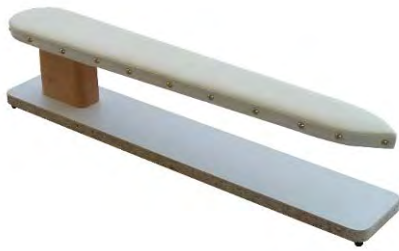
Artikel 54-20 Ärmel-Bügelbock, das ideale Gerät für die Damenschneiderei. Größe: 68cm lang, in der Mitte 10cm breit.