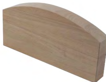
Kragenklotz aus Buchenholz