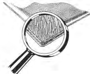
Bügelblatt „FAKIR“, zum Bügeln von Samt, Duvetin usw.