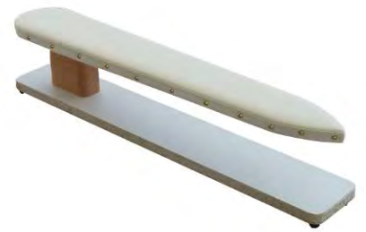
Artikel 54-21 Ärmel-Bügelbock, das ideale Gerät für die Herrenschneiderei. Größe: 72cm lang, in der Mitte 10,5cm breit.