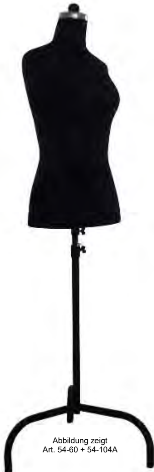
Abbildung zeigt Art. 54-60 + 54-104A