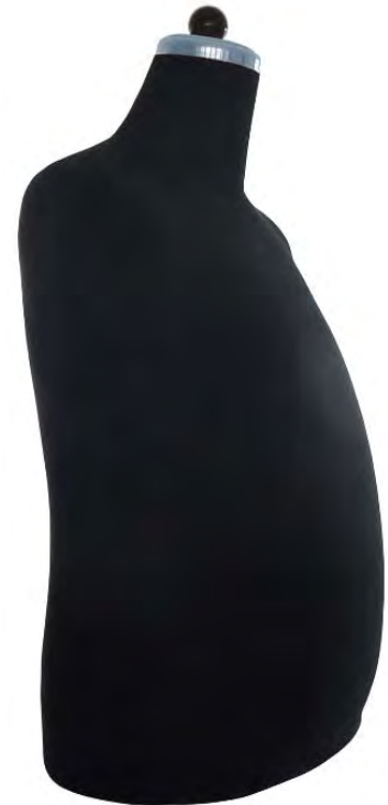
Abbildung zeigt Art. 54-53