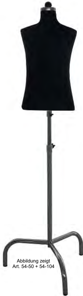
Abbildung zeigt Art. 54-50 + 54-104