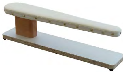
Artikel 54-20A Ärmel-Bügelbock, gleiche Ausführung wie Art. 54-20, jedoch in schmalere Ausführung.