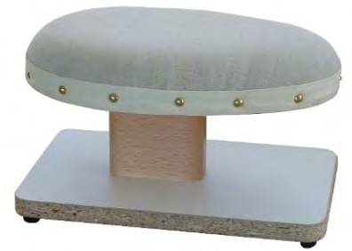
Artikel 54-14A Achsel-Bügelbock „Berliner Form“, mit Kork gefüllt auf Hartholzbock mit Pressspangrundplatte montiert. Größe: 30 x 15cm.