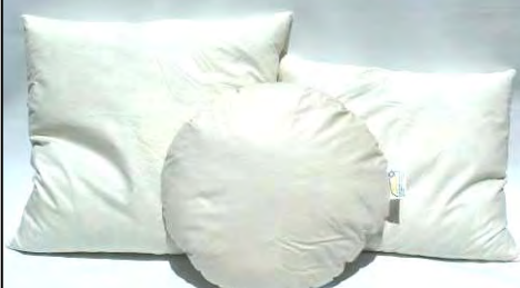
40 x 40cm Form: quadratisch Ø: 40cm Form: rund 40 x 50cm Form: rechteckig