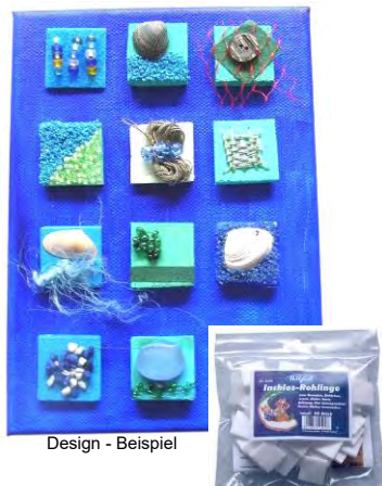
Design - Beispiel

Zum Gestalten, Dekorieren und für kreative Arbeiten. Man kann darauf alles Verarbeiten was man aus der Handarbeits- und Bastelwelt kennt. Lassen Sie Ihrer Kreativität freien Lauf.