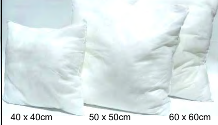
40 x 40cm 50 x 50cm 60 x 60cm