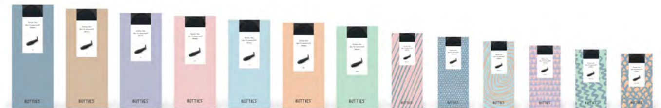
Für kreative Schuhdesigns stehen 13 Größen zur Verfügung! There are 13 sizes available for creative shoe designs!