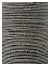
14 m Hellgrau / Light grey N023