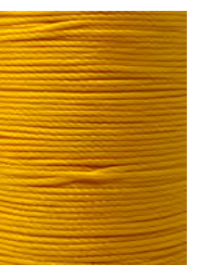
14 m Gelb / Yellow N041