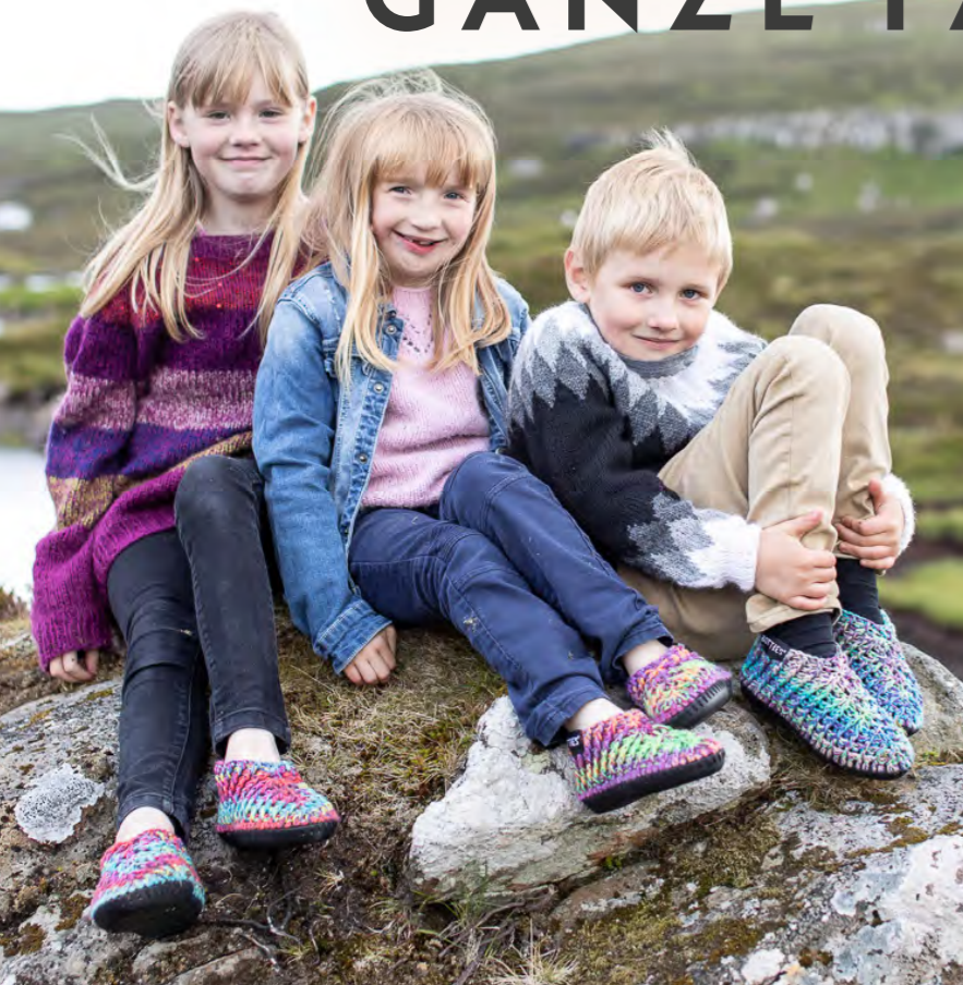
Häkelbotties für Kinder → Anleitung enthalten im Lookbook #2, S. 20 Crochet Botties for Kids → Instruction included in Lookbook #2, p. 20