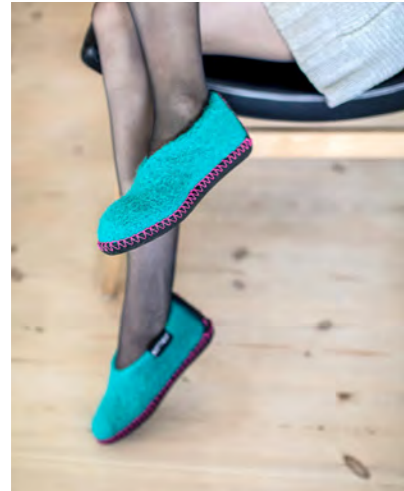
Filzpuschen → Anleitung S. 21 Felted slipper socks → Instruction p. 21