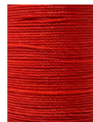
14 m Rot / Red N049