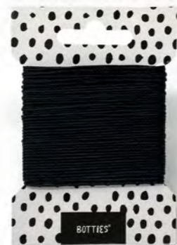
14 m Schwarz / Black N999