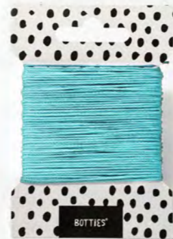
14 m Mint N074