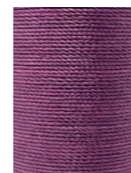
14 m Lila / Purple N047