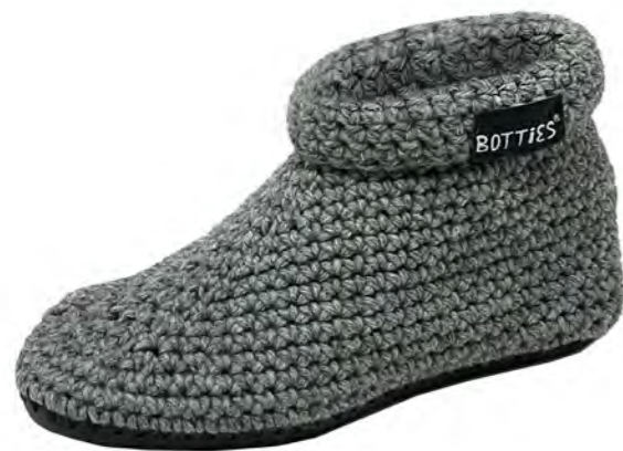
Artikel Nr. / article no. KM-C501

1 finished crocheted shoe with matching insole and presentation foot. Color requests can not be taken into account.