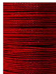
14 m Bordeaux N050