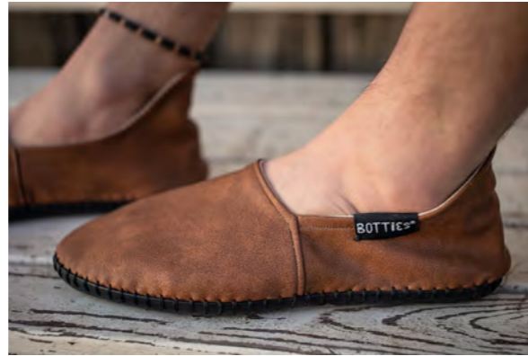
Genähte Espadrilles → Anleitung enthalten im Lookbook #1, S. 20 Sewn Espadrilles → Instruction included in Lookbook #1, p. 20