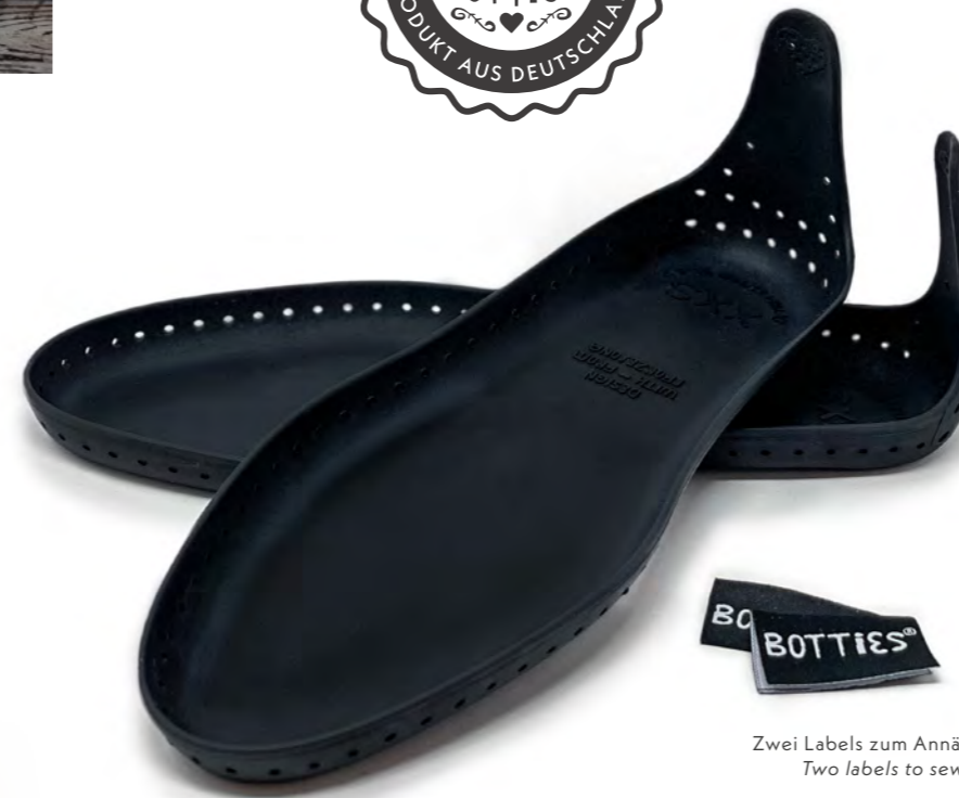
Zwei Labels zum Annähen inklusive! Two labels to sew on included!

Material: – Thermoplastisches Polyurethan (2,5 mm dünn) – hautfreundlich & 100% recyclebar – maschinenwaschbar bis 60°C