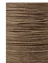
14 m Sandbraun / Sandy brown N025