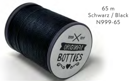
65 m Schwarz / Black N999-65