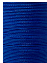
14 m Blau N037