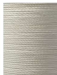
14 m Weiß / White N000