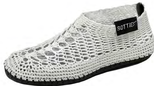
Artikel Nr. / article no. KM-C407