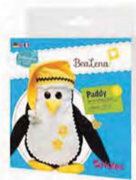
Paddy, der Kuschelpinguin Art.-Nr. 348466