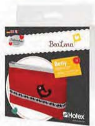
Betty, das Kulturtäschchen Art.-Nr. 348468