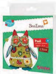
Pauli, die kleinen Stoffeulen Art.-Nr. 348463

Entdecken Sie weitere schöne Dinge aus der Bealena® Welt: