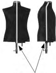
Dehnungsschlitze (durch Überzug im Original nicht sichtbar)