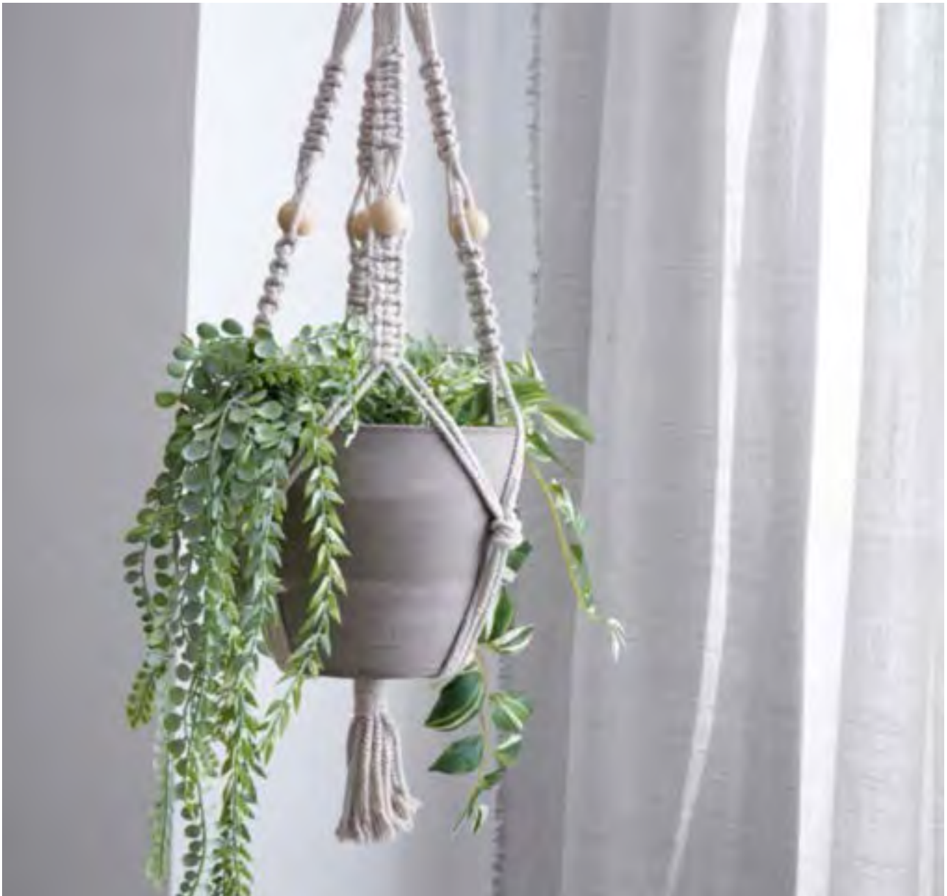
CLEO S10902 **