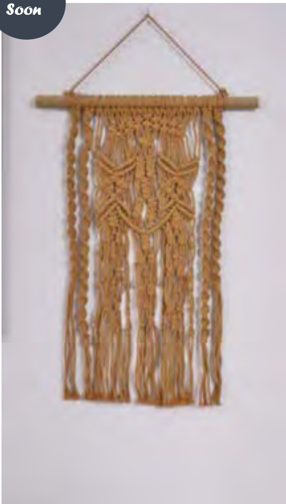
ALBERT S10901 **