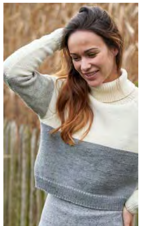
OLGA S10395 | Magazin 043 Merino Moments