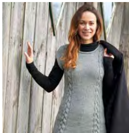
KATALINA S8873 | Magazin 043 Merino Moments