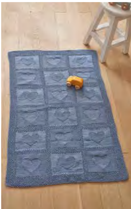
HERZ S9689B | Magazin my home 2