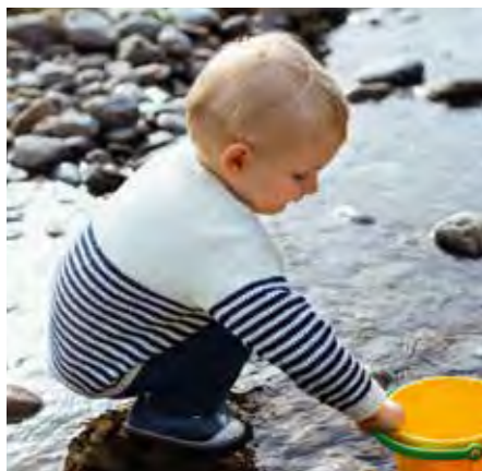
CHARLIE BS10211 | Little FlexEssentials Toddler