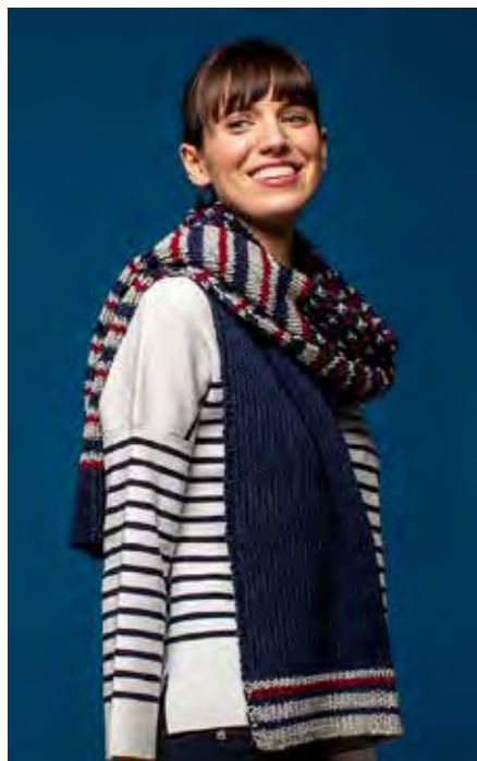
LOLA S10618 | Magazin 040 Merino Moments