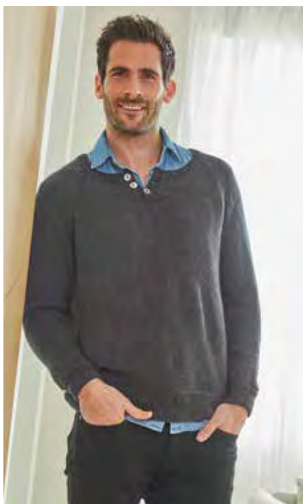
MARTIN S9206 | Magazin 043 Merino Moments