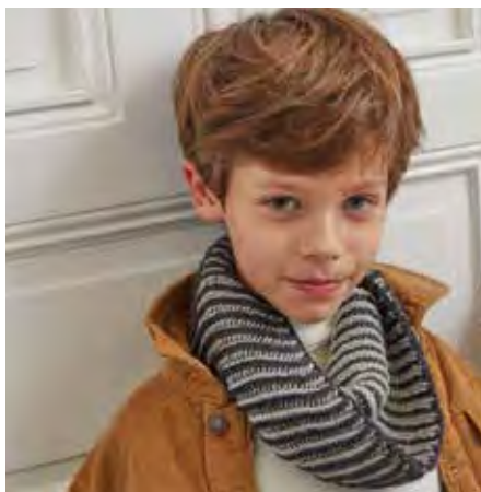
MICKE S11072 | Magazin 043 Merino Moments