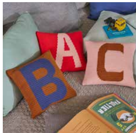
OTTI S11078A-C | Magazin my home 2