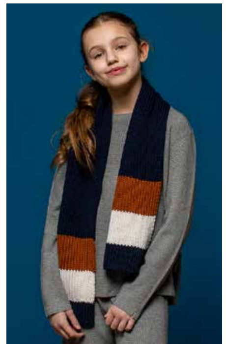
JAMIE S10620 | Magazin 040 Merino Moments