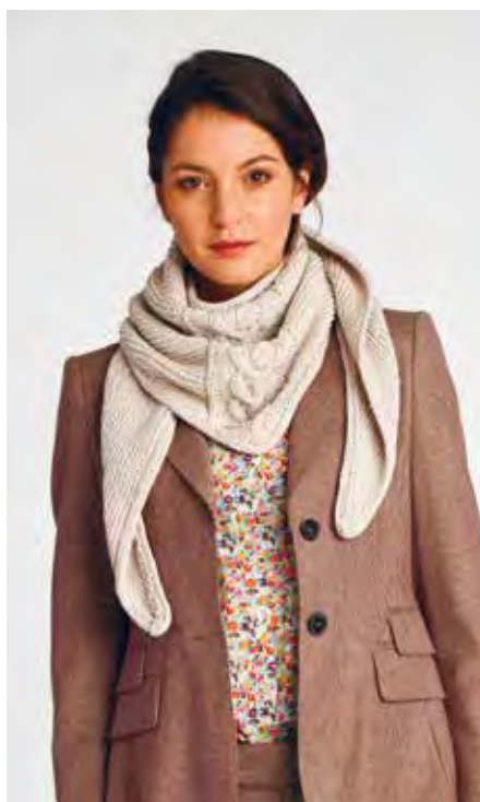
LENI S10602 | Webdesign