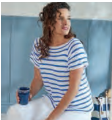
LILIANA S10973 | Booklet Pyramid Cotton