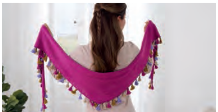
MARULA S11294 | Magazin 047 Summer Trends