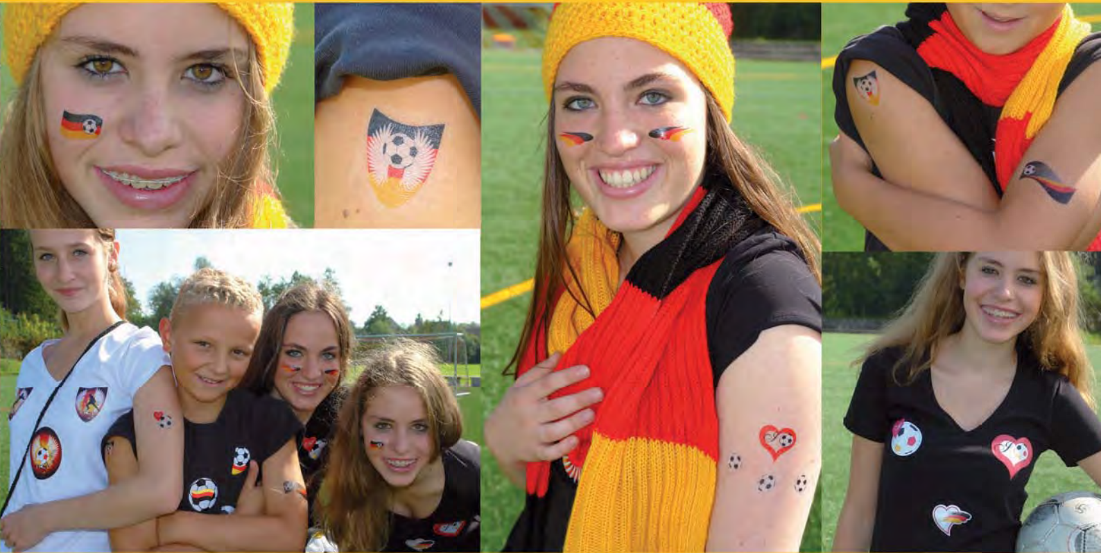
Abb. ca. 40 % der Originalgröße.