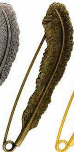
08 Or antique