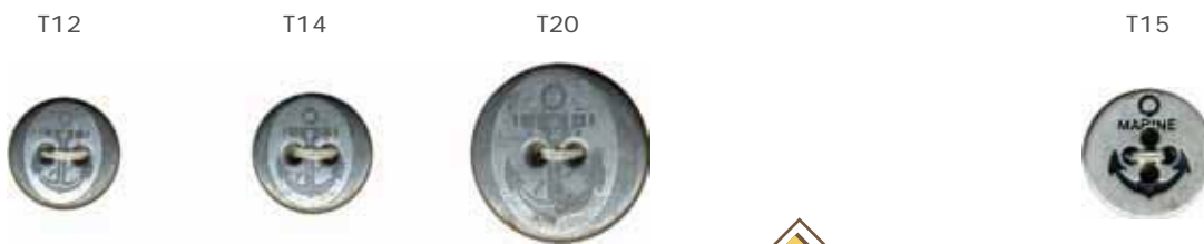
04 Argent vieilli