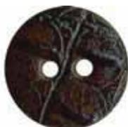
570 Marron T23