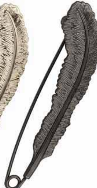
578 Canon de fusil