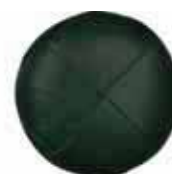
104 Vert bouteille