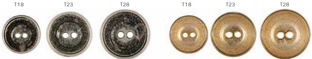
04 Argent vieilli