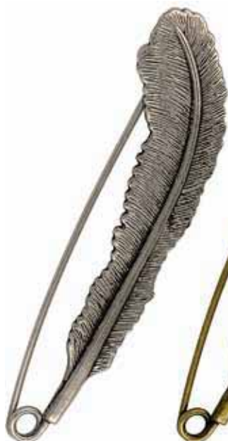
04 Argent antique