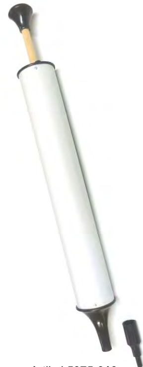
Artikel 5075-010 Putzi – Kunststoffblasrohr / Blasebalg zum Ausblasen von z.B. Nähmaschinen, Bohrlochern usw., wenn gerade keine Pressluft zur Hand ist. Mit Reduzierstück. Zylinder: ca. 40cm lang, Ø ca. 6cm Länge: ca. 53cm gesamt