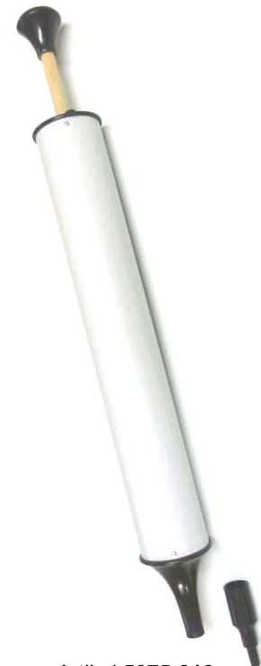
Artikel 5075-010 Putzi – Kunststoffblasrohr / Blasebalg zum Ausblasen von z.B. Nähmaschinen, Bohrlochern usw., wenn gerade keine Pressluft zur Hand ist. Mit Reduzierstück.

Zylinder: ca. 40cm lang, Ø ca. 6cm Länge: ca. 53cm gesamt