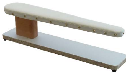
Artikel 54-20A Ärmel-Bügelbock, gleiche Ausführung wie Art. 54-20, jedoch in schmalere Ausführung.