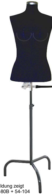
Abbildung zeigt Art. 54-80B + 54-104

Grund- größe: Verstellbar auf Größen: 46 = 47, 48, 49 und 50 48 = 49, 50, 51 und 52 50 = 51, 52, 53 und 54 52 = 53, 54, 55 und 56