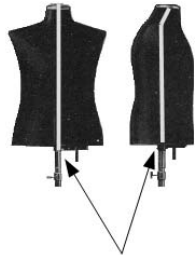
Dehnungsschlitze (durch Überzug im Original nicht sichtbar)