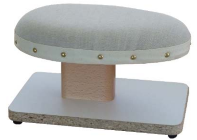
Artikel 54-14A Achsel-Bügelbock „Berliner Form“, mit Kork gefüllt auf Hartholzbock mit Pressspangrundplatte montiert. Größe: 30 x 15cm.