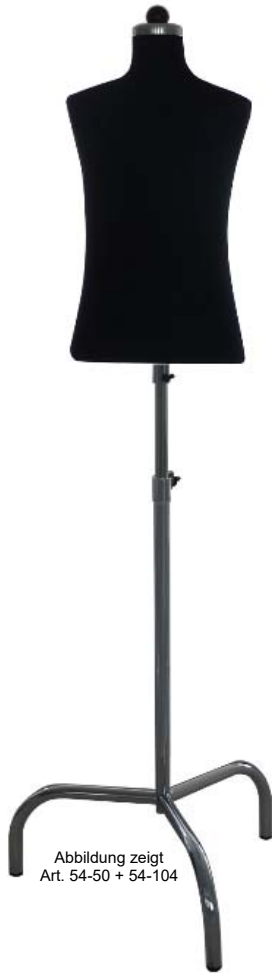
Abbildung zeigt Art. 54-50 + 54-104