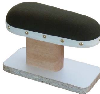
Artikel 54-88 Achsel-Bügelbock, mit Kork gefüllt auf Hartholzbock mit Pressspangrundplatte montiert. Größe: 25 x 11 cm.