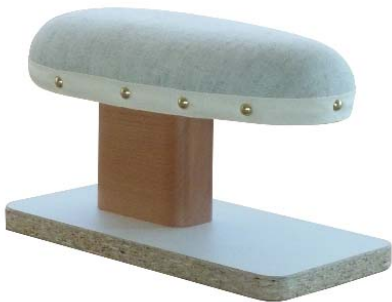
Artikel 54-14B Achsel-Bügelbock „Potsdamer Form“, mit Kork gefüllt auf Hartholzbock mit Pressspangrundplatte montiert. Größe: 33 x 20cm.