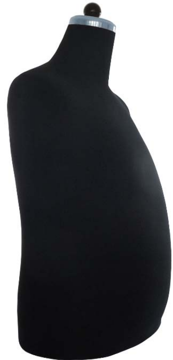
Abbildung zeigt Art. 54-53