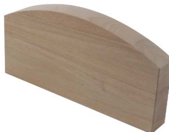
Kragenklotz aus Buchenholz

Artikel 54-93 75cm lang Artikel 54-93/1 65cm lang