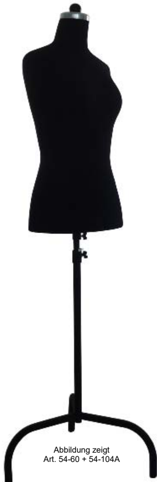
Abbildung zeigt Art. 54-60 + 54-104A