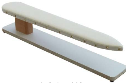
Artikel 54-21A Ärmel-Bügelbock, gleiche Ausführung wie Art. 54-21, jedoch in besonders breiter Ausführung. Größe: 80cm lang, 25cm breit.