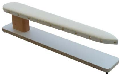
Artikel 54-20 Ärmel-Bügelbock, das ideale Gerät für die Damenschneiderei. Größe: 68cm lang, in der Mitte 10cm breit.