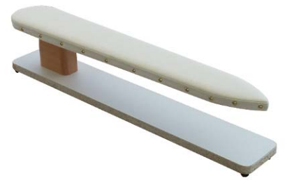
Artikel 54-21 Ärmel-Bügelbock, das ideale Gerät für die Herrenschneiderei. Größe: 72cm lang, in der Mitte 10,5cm breit.