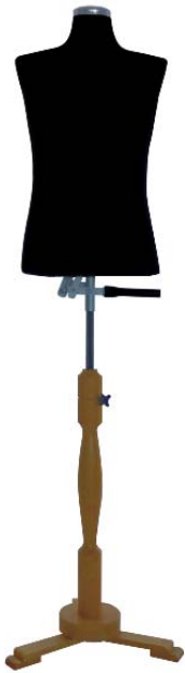
Abbildung zeigt Art. 54-80A + 54-102